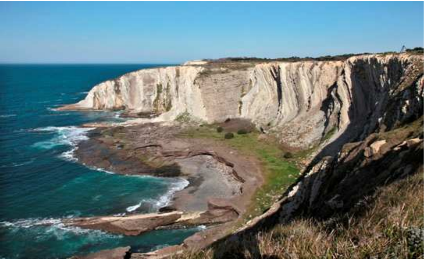
Tunelbokaren ondoan dagoen haitzari Alpenarri deitzen zaio.